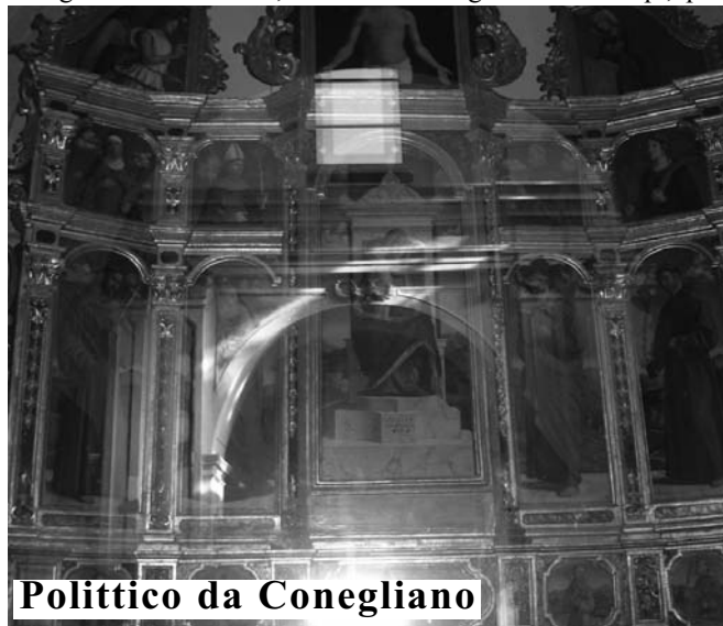
Polittico da Conegliano