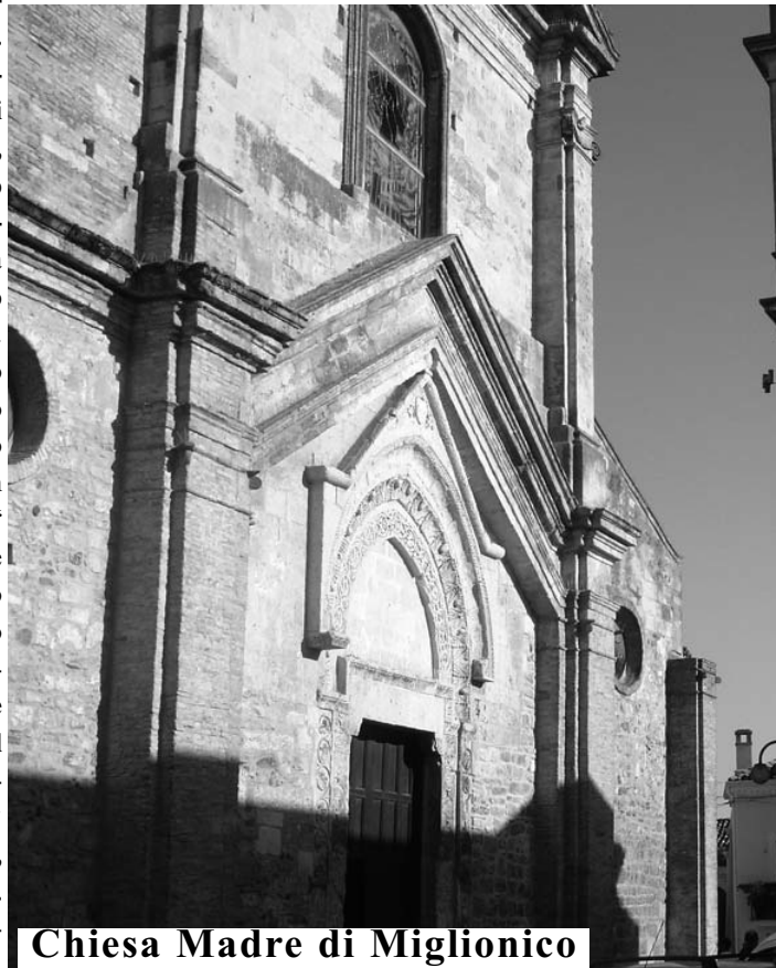
Chiesa Madre di Miglionico

tedre, lo chiamerebbe professore tutta l'Italia e l'Europa, e lui è invece contento di stare qui a Miglionico con la sua prodigiosa ed immensa cultura e il suo mantello a pezzi. Si ferma accanto ad un candeliere, raccoglie la cera di una candela che sta per finire “ Devo fare economie “ dice “ ho già tanti debiti. Ma oggi è una bella giornata è sempre una bella giornata fino a quando conservi la speranza ”. Si stringe nel mantello che è grande e solenne come quello di un antico re, e questa Chiesa è una reggia, anche se l'unico suddito è un bambino che è entrato adesso col